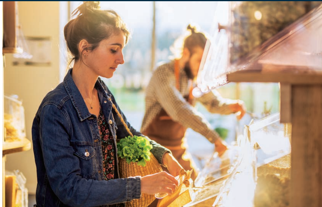
Frische Produkte Unter den Bio- und Naturmärkten markieren Alnatura, Denn's und Basic die Spitze